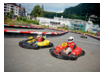
Elektro-Kartbahn im Swiss Holiday Park (Reka-Ferendorf), Morschach