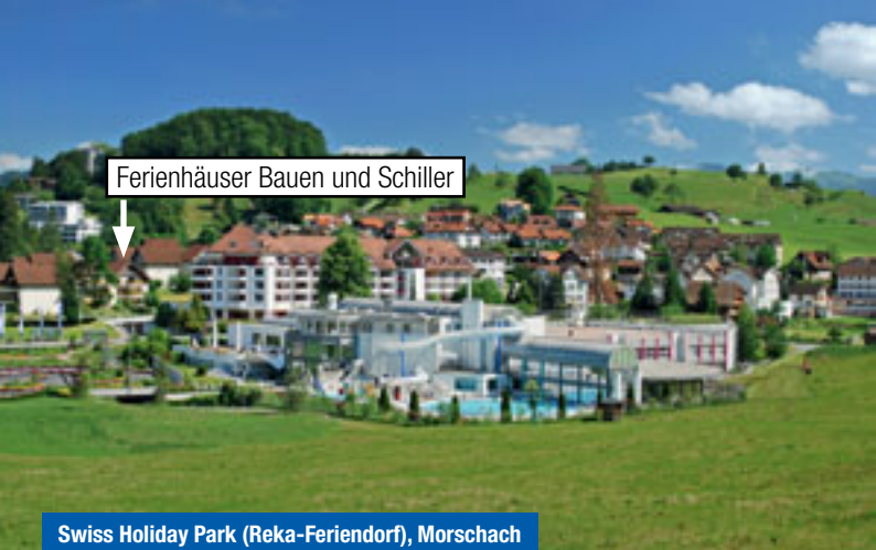
Swiss Holiday Park (Reka-Ferendorf), Morschach