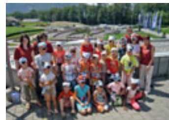
Rekalino-Familienprogramm im Swiss Holiday Park (Reka-Ferendorf), Morschach

Familienprogramm: vom 1. Dezember 2010 bis 30. November 2011: Rekalino-Familienprogramm von Sonntag bis Freitag (in der Regel 3–6 Stunden pro Tag) und 1 x pro Woche ein Kinderstamm (17.00–21.00 Uhr inkl. Verpflegung) und 3 x ein Mittagstisch. Teilweise werden Ganztagesaktivitäten durchgeführt.