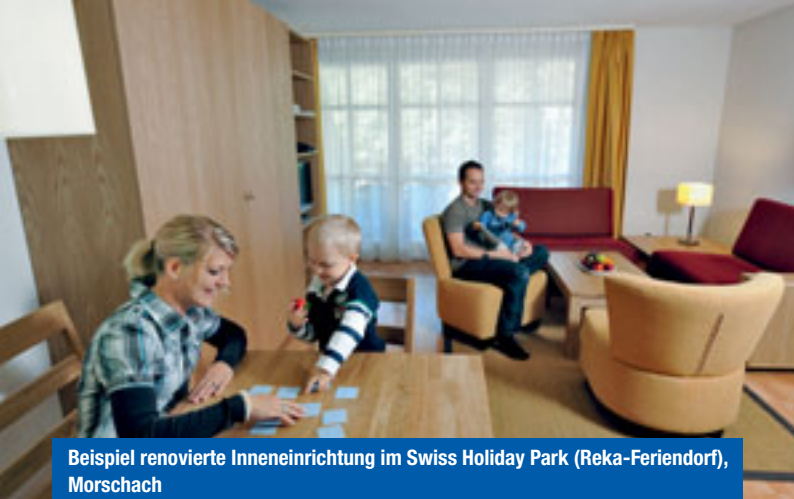
Beispiel renovierte Inneneinrichtung im Swiss Holiday Park (Reka-Ferendorf), Morschach