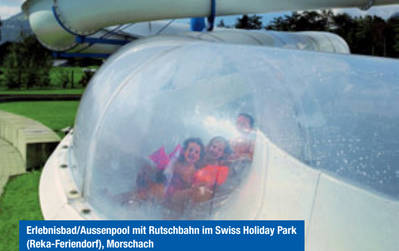
Erlebnisbad/Aussenpool mit Rutschbahn im Swiss Holiday Park (Reka-Ferendorf), Morschach