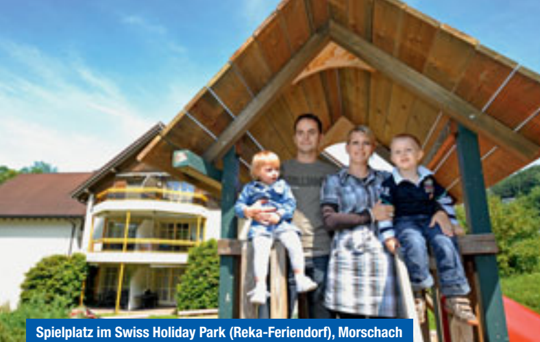
Spielplatz im Swiss Holiday Park (Reka-Ferendorf), Morschach