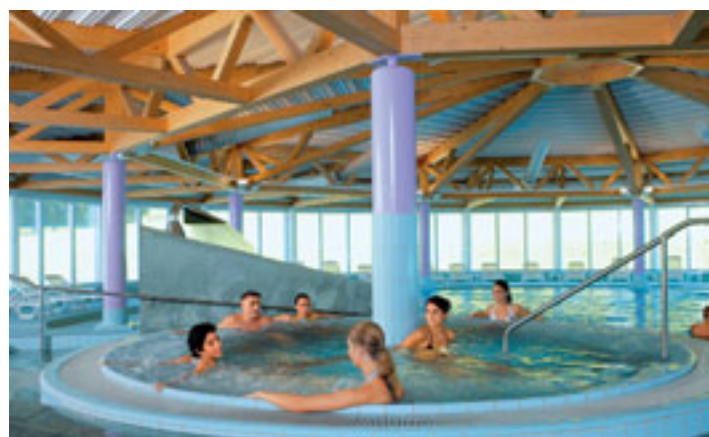
Bäderlandschaft mit Innenpool und Whirlpool im Swiss Holiday Park (Reka-Ferendorf), Morschach