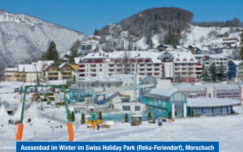
Aussenbad im Winter im Swiss Holiday Park (Reka-Ferendorf), Morschach