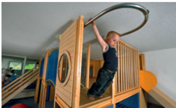
Spiel und Spass im Swiss Holiday Park (Reka-Ferendorf), Morschach