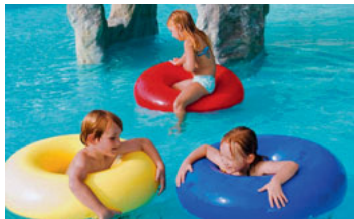
Felsenlandschaft im Swiss Holiday Park (Reka-Ferendorf), Morschach